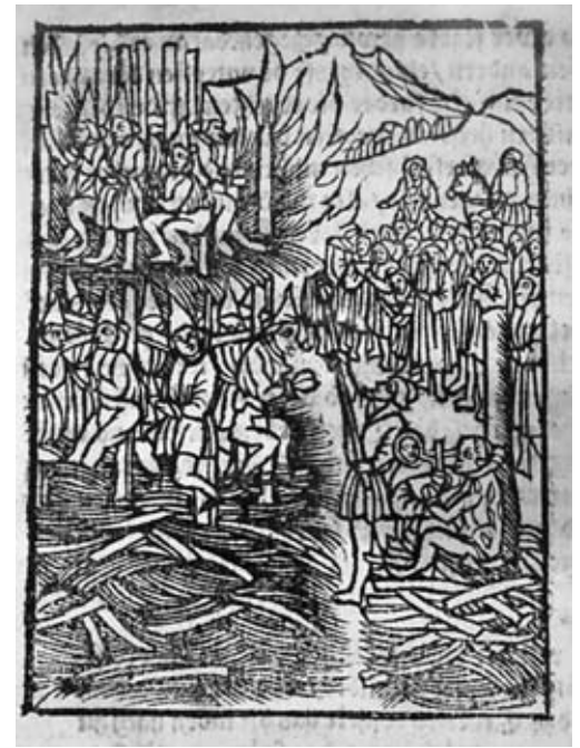
Der auf dem Rabenstein, dem heutigen Strausberger Platz, errichtete Scheiterhaufen für die Juden. Holzschnitt, 1511

So auch hier. Ein möglicher jüdischer Abnehmer für die vom christlichen Dieb gestohlene Hostie ist bald gefunden, sein Geständnis bereits am nächsten Tag mit Hilfe des Henkers ermittelt. Das reicht, um alle übrigen männlichen Brandenburger Juden zu verhaften. Da man dennoch nur 36 von ihnen wegen vermeintlicher Hostienschändung anklagen kann, wird die Beschuldigung kurzerhand um den Punkt »Kindesmord zwecks Christenblutgewinnung« erweitert – wobei man von anonymen Kindern ausgeht, die unbekanntes Durchreisenden abgekauft wurden. Damit können 51 Juden angeklagt werden (darunter die wichtigsten Steuerzahler), von denen bei Prozessbeginn, drei Wochen später, noch 41 am Leben sind. Drei lassen sich taufen und erhalten mildere Strafen (zwei werden geköpft, der dritte, ein bekannter Augenarzt, diskret begnadigt), die anderen 38 zum Feuertod verurteilt. Sie haben, wie wir aus Augenzeugenberichten wissen, gemeinsam laut gebetet und »mit großer bestendigkeyt den todt gelitten, den pawvelligen [pöbeligen] Christenn zcu sundern erschrecken«. Die übrigen Brandenburger Juden werden enteignet und aus dem Land gewiesen,