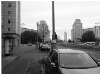
Der Rabenstein, heutiger Strausberger Platz

»freiwilliges« Geständnis im Sinne der Anklage vorlag, pflegte ein Präzedenzfall den anderen nach sich zu ziehen.